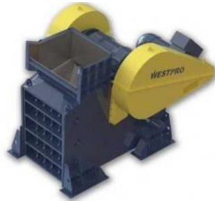
Chancadoras de Mandíbula