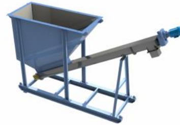
Tolvas de alimentación