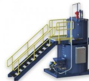
Sistemas de preparación y dosificación de floculantes