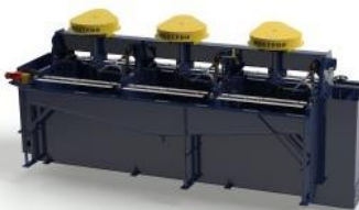
Celdas de flotación