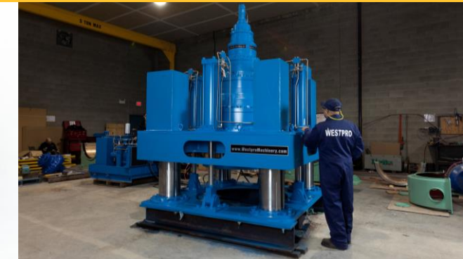
Accionador Hidráulico para Espesador.