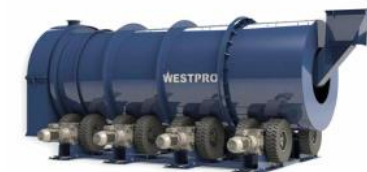
Separadores de tambor