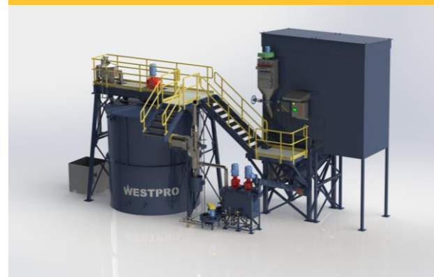
Diseño de una planta de Cal