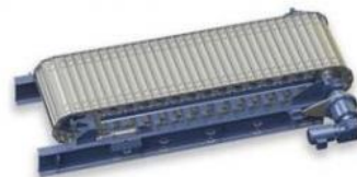
Alimentadores de Banda