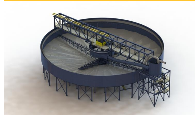
120' Diseño de Espesador de Alta capacidad.