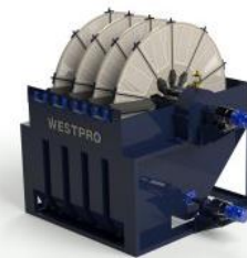
Filtros de disco