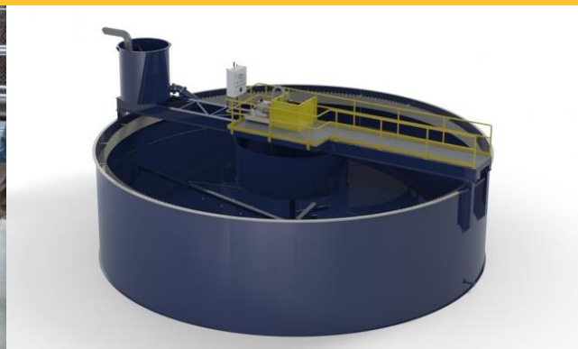
Diseño de Clarificador