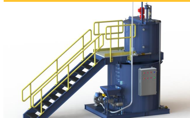
Diseño de un Sistema de Mezcla de Floculante