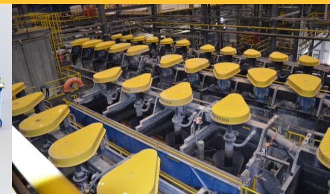
Circuito de Flotación, Planta de Litio, Quebec, Canadá