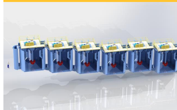
FL4600TC Celdas de Flotación tipo Tanque