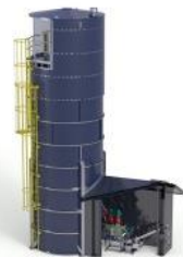
Sistemas de preparación y dosificación de reactivos