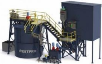
Plantas de Cal