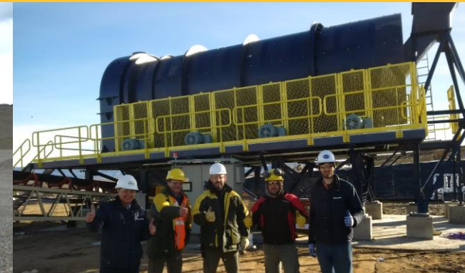
Aglomerador accionado por neumáticos, en Argentina