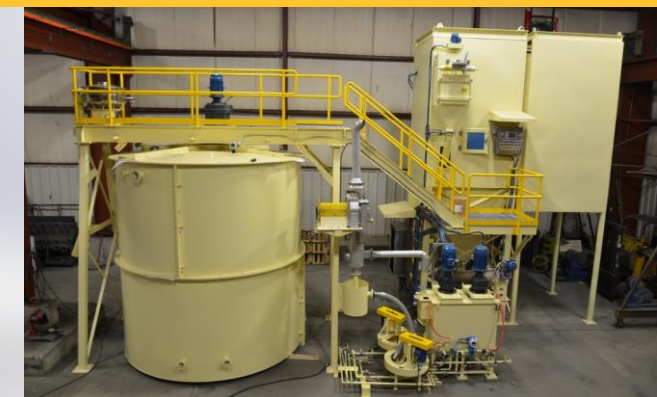
Planta de Cal con apagador tipo detención