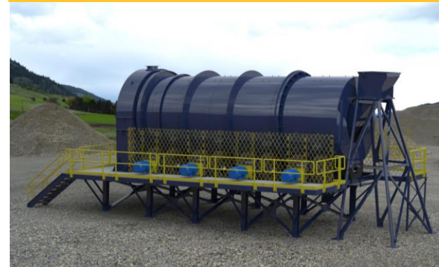
Diseño de un Aglomerador accionado con neumáticos