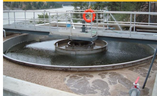
Clarificador 26' en PTAR en BC, Canadá