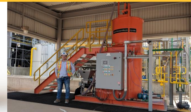
Sistema de Mezcla de Floculante en Sitio, México