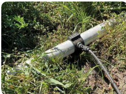
TUBERÍAS DE HDPE