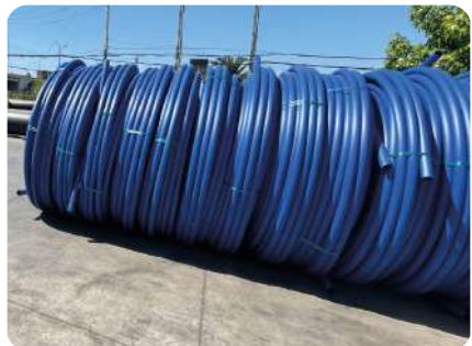
IDENTIFICACIÓN DE PRESIÓN NOMIAL