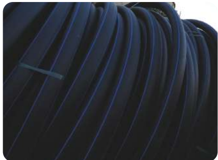
TUBERÍAS DE HDPE

Nuestras soluciones se ocupan en distintos rubros, siempre pensadas en las necesidades del mercado.