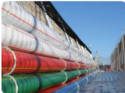
IDENTIFICACIÓN DE PRESIÓN NOMIAL