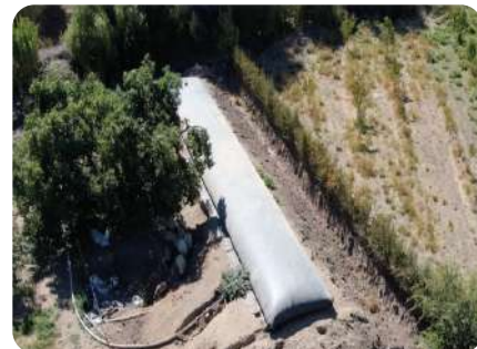
TANKMAX ESTANQUE DE AGUA